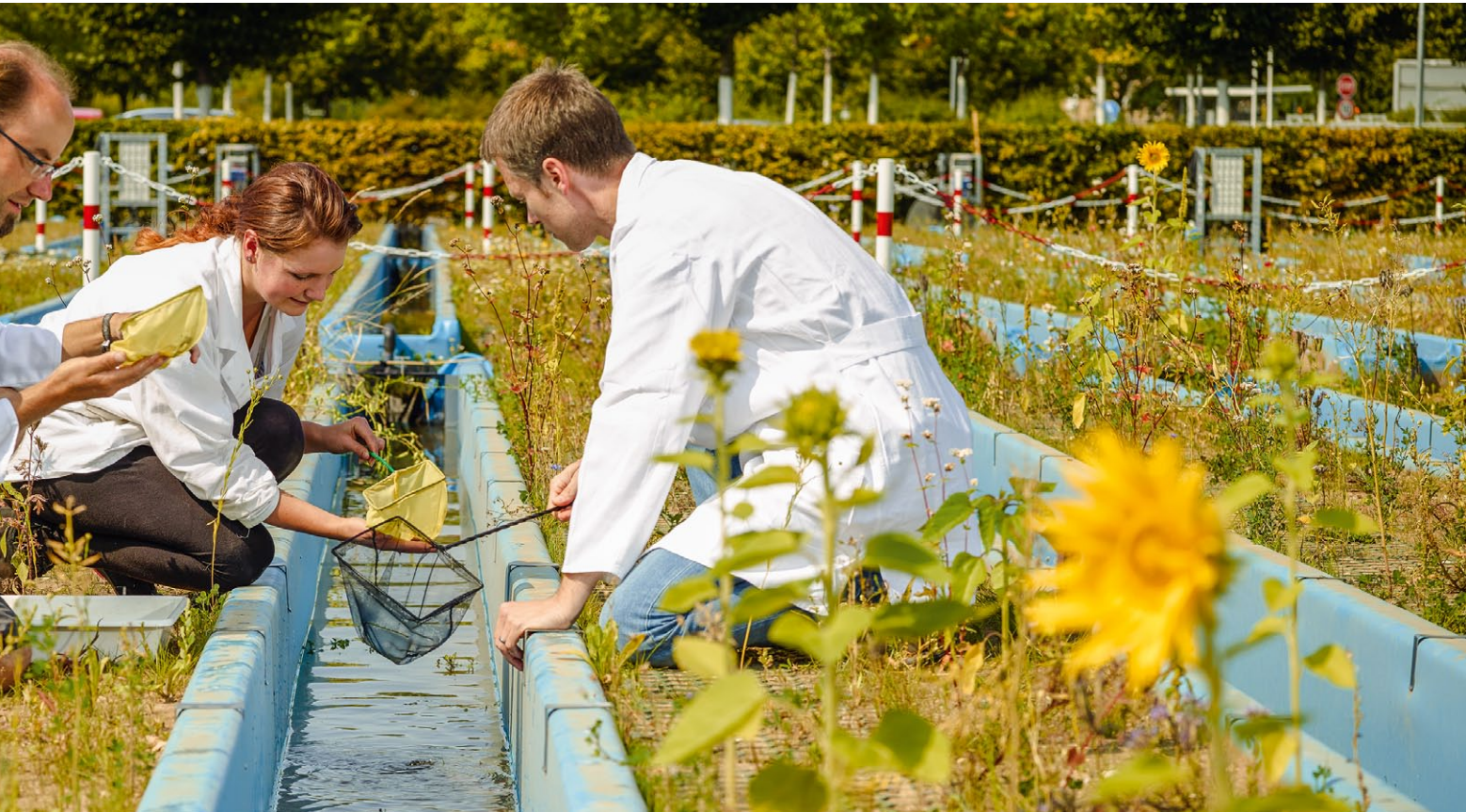
...ss realitätsnaher werden. So lautet eine Forderung der Leipziger Wissenschaftler. Entscheidende Erkenntnisse erhoffen sie sich von einem der weltweit größten Fluss-Experimente. In 47 jeweils 14 Meter langen künstlichen Fließbännen testen die Forscher dort die Reaktionen von Wasserlebewesen auf Pestizide unter deutlich realeren Bedingungen

sich mit der Frage, wie sich die potenziellen Übeltäter von harmloseren Kandidaten unterscheiden lassen. Dabei interessieren sie sich vor allem für die Rückstände, die solche Substanzen im Boden oder im Grundwasser hinterlassen.