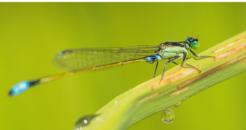
Forscher haben nachgewiesen, dass hohe Pestizideinträge die Artenvielfalt in Fließgewässern um mehr als 40 Prozent reduzieren können. Insektenarten wie die in Asien verbreitete Kleinlibelle Ischnura senegalensis sind besonders bedroht.