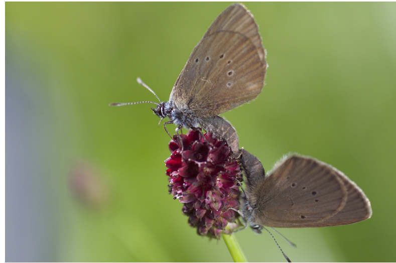
Dunkler Wiesenknopf-Ameisenbläuling, Maculinea nausithous , Paarung auf der Blüte des Wiesenknopfs, Foto: André Künzelmann/UFZ

Die Ergebnisse aus der UFZ-Forschung fließen in Handlungsempfehlungen ein, so zum Beispiel für den Naturschutz. Weiden und Wälder sollten aktiv gepflegt und so vielfältig wie möglich gestaltet werden, um Europas am stärksten gefährdete Tagfalter vor dem Aussterben zu bewahren. Diese und weitere Empfehlungen für 29 bedrohte Schmetterlingsarten hatte ein Team von Wissenschaftlern 2012 unter Leitung der „Butterfly Conservation Europe“ veröffentlicht. Vier UFZ-Forscher haben 2014 auch einen einmaligen Datensatz zu den Klima-Nischen von knapp 400 europäischen Schmetterlingsarten veröffentlicht ( CLIMBER: Climatic niche characteristics of the butterflies in Europe ). Diese Daten umfassen nahezu alle Tagfalterarten Europas. Sie sollen künftig helfen, die Bedrohung der Populationen besser einzuschätzen, denn diese Arten könnten als wirksamer Indikator für den Zustand von Ökosystemen dienen, zumal zu vielen von ihnen ausreichend zuverlässiges Wissen über ihre ökologischen Ansprüche vorhanden ist. Auf einer solchen Grundlage hatten Wissenschaftler im EU-Projekt