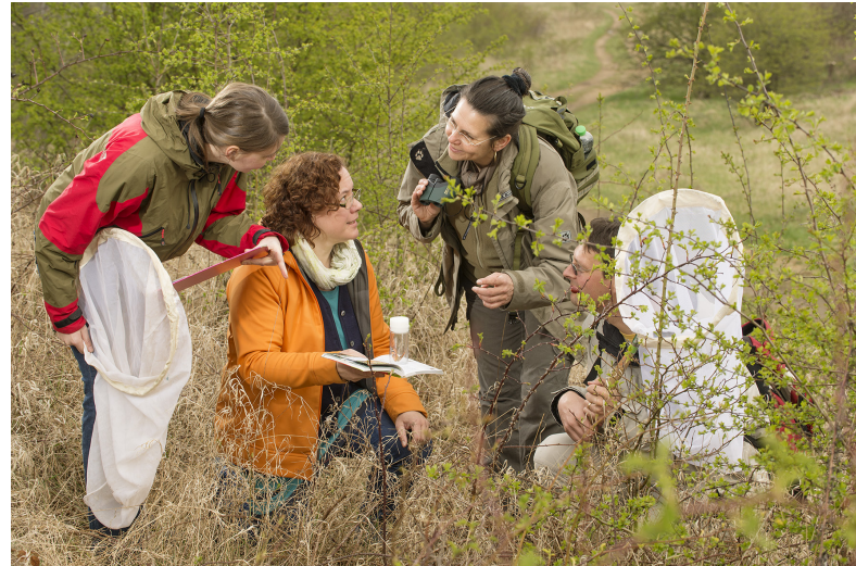
Beim Tagfalter-Monitoring-Deutschland (TMD) gehen Freiwillige bundesweit regelmäßig auf Schmetterlingssuche.