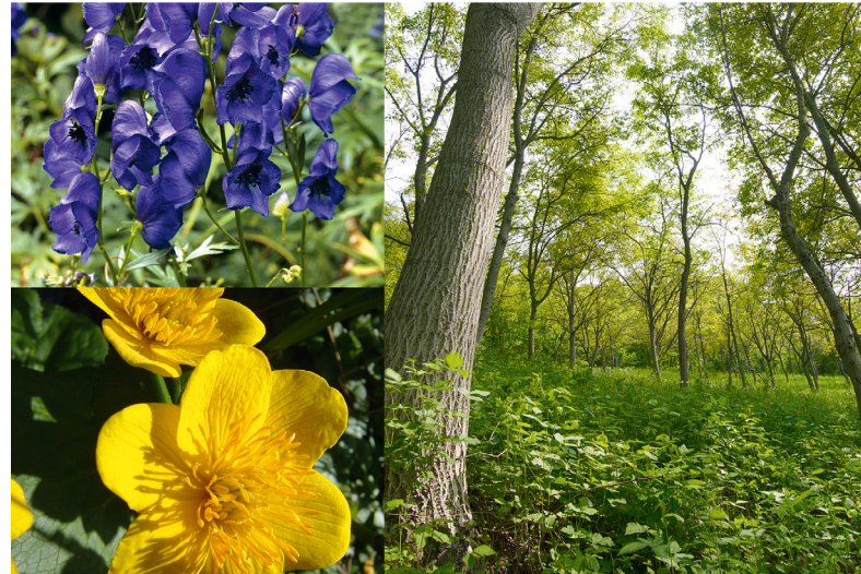
Blauer Eisenhut (Bild oben links, Foto: emer – Fotolia.com) und die Sumpfdotterblume (Bild unten links, Foto: Rainer Tagwercher – Fotolia.com) sind zwei Beispiele von Pflanzenarten, die durch den Klimawandel potenziell stark gefährdet sind. Wenngleich weit geringer, wird es nach den Computermodellen auch Pflanzenarten geben, die ihre Verbreitungsgebiete ausdehnen. Ein Beispiel ist die Echte Walnuss (Bild rechts, Foto: Georg Teutsch/UFZ)

Gewinner und Verlierer wird es auch in der Vegetation geben. Während beispielsweise die Fichte ( Picea abies ) immer weniger mit den Temperaturen in Deutschland zurechtkommen wird, liebt es die Echte Walnuss ( Juglans regia ) wärmer und wird sich daher weiter ausbreiten können. Bei einem extremen Temperaturanstieg von über 4°C könnte bis 2080 jede fünfte Pflanzenart über 80 Prozent ihres Verbreitungsgebietes verlieren. Vor allem für den Südwesten und die tiefen Lagen im Nordosten von Deutschland rechnen Modellsimulationen mit einer großen